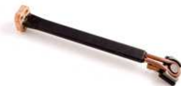
Seiteninduktor IND5KW/S03 mit Strömungskonzentrator